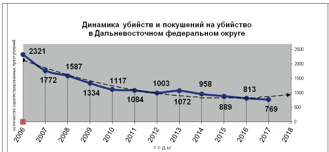
Рис. 1. Динамика убийств и покушений на убийство в Дальневосточном федеральном округе

В 2017 г. в ДФО зарегистрировано 769 убийств и покушений на убийство, что является минимумом за последние десять лет [6]. По сравнению с 2006 г., число преступлений данного вида сократилось в 3 раза! (с 2321 до 769) при неизменной методике их подсчета. Важно отметить, что число зарегистрированных убийств и покушений на убийство снижается непрерывно и последовательно, из года в год в течение последних одиннадцати лет, за исключением 2013 г., когда был отмечен рост на 7% (см. рис. 1).