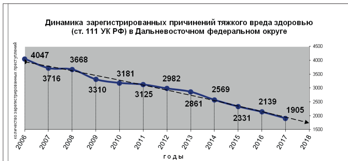
Рис. 2. Динамика преступлений, предусмотренных ст. 111 УК РФ, в Дальневосточном федеральном округе

Кроме правоохранительных органов свою статистику убийств ведут органы здравоохранения*. При составлении медицинского свидетельства о смерти врач фиксирует причину смерти в виде соответствующего кода, указанного в Международной классификации болезней (МКБ), принятой Всемирной организацией здравоохранения.